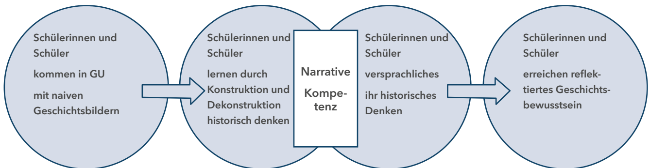
Prozessmodell des Geschichtsunterrichts