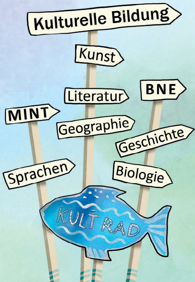
Gestaltung: Julia Kaergel

Mit dem Projekt KultRad können Kinder und Jugendliche den eigenen Schulweg sichtbar und kulturell erfahrbar machen. Vorhandene Radwege können sie mit selbst entwickelten Kulturangeboten spannender gestalten und eigene Radrouten zu neuen Erlebnispfaden ausgestalten oder in Vergessenheit geratene Orte wiederentdecken.