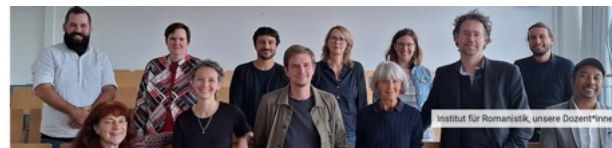
Institut für Romanistik, unsere Dozent*innen

Neben den Lehramtsstudiengängen Französisch bzw. Spanisch bieten wir auch den trinationalen Bachelor-Studiengang „Transkulturelle Europastudien: Sprachen, Kulturen, Interaktionen“ an, der das Studium in Flensburg sowie in Straßburg (Frankreich) und Málaga (Spanien) umfasst.