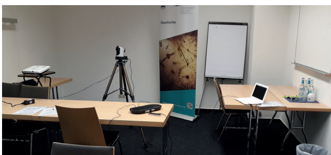
Die Regiezentrale - ein etwas anderer Anblick als bei Präsenzveranstaltungen

https://fachportal.lernnetz.de/geschichte.html