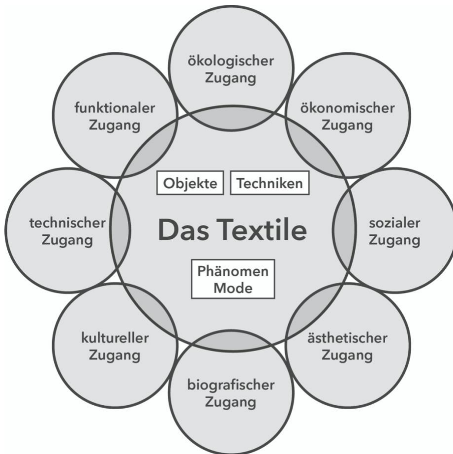
Abbildung 1: Das Textile und die einzelnen Zugänge

Im Folgenden werden die einzelnen Zugänge beschrieben: